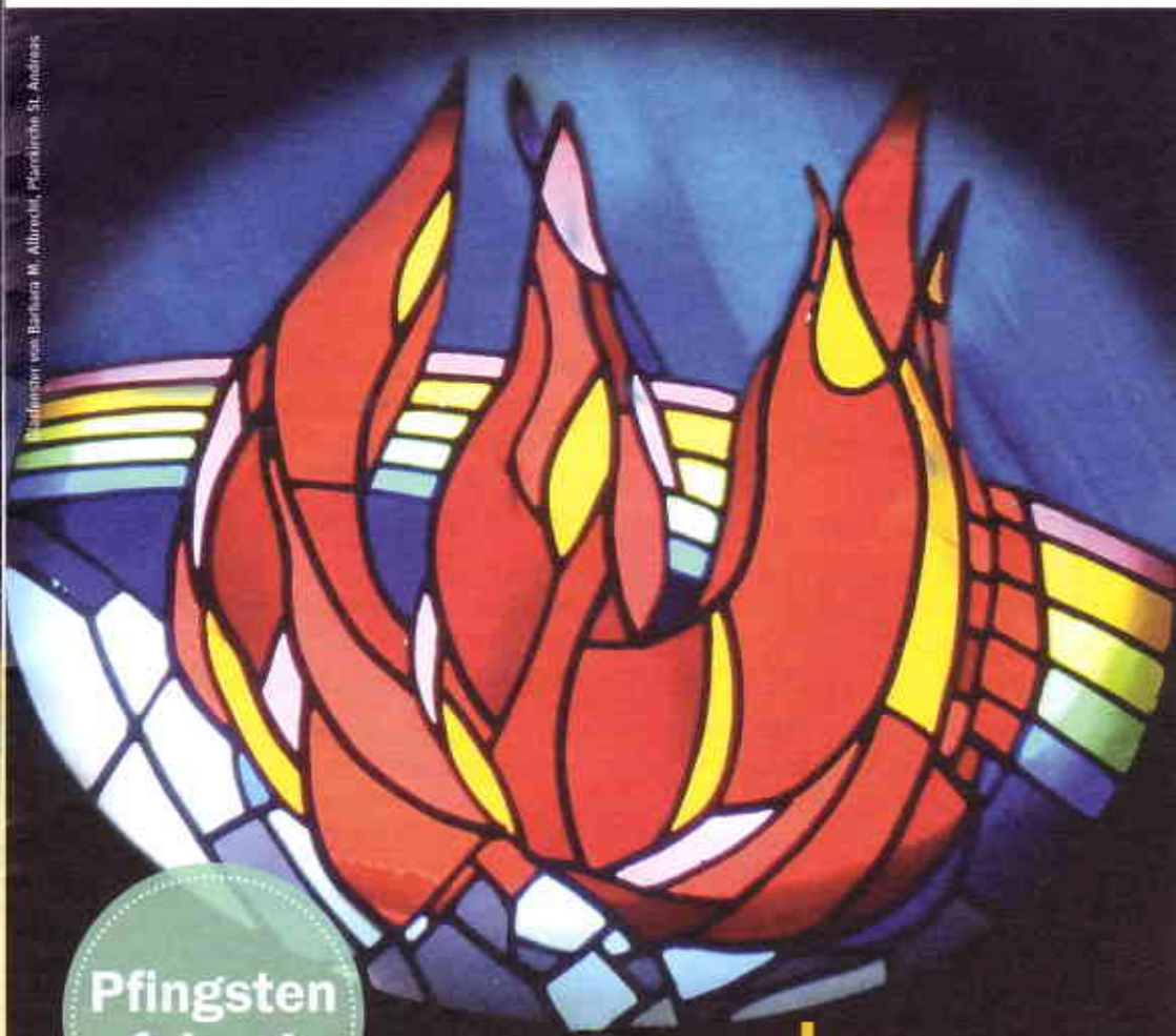
Illustration von Barbara W. Allurecht, Pfarrkirchen, St. Adelgundis